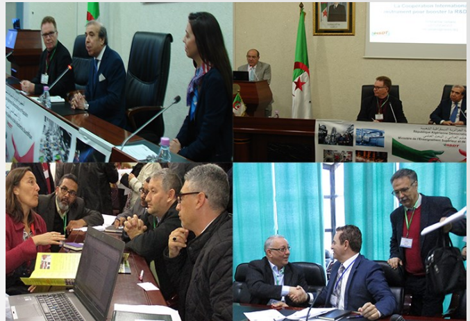
Journée du lancement du deuxième appel bilatéral Espagne-Algérie, nommé ALGESIP

L'objectif partagé par les deux Agences est celui de promouvoir et de financer des projets de coopération «R+D appliquée» menés par des entités des deux pays qui puissent arriver au marché grâce à la génération ou à l'amélioration d'un produit, d'une technologie ou d'un processus innovant.